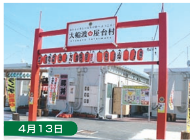
4月13日 岩手県大船渡市へ3回目調査「復興の憩いの場」