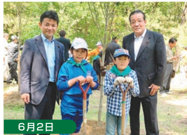
6月2日 やまがた森の感謝祭で子供たちと植樹