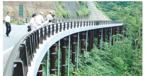
宮城県加美町「国道347号線」 年間通行対策に向けて現場視察と意見交換