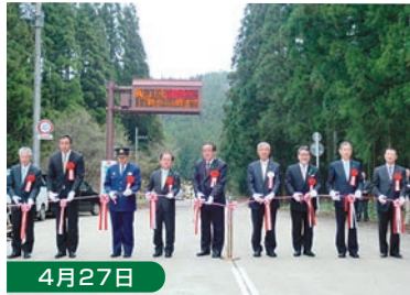
4月27日 鳥海ブルーライン開通式