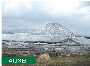
4月3日 爆弾低気圧によるビニールハウス・被害調査